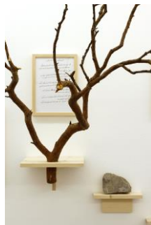
Ülkü Süngün Lacrimarium Europae , 2015, aus der Werkgruppe »Anlatsam Roman Olur / Die besten Romane schreibt das Leben« , 2014–2016 Regale, Steinreliefs, Zweige, Glasflakons, Dokumente, Briefe, Fotokopien, Farbfotografie Ausstellungsansicht Villa Merkel, Bahnwärterhaus, Galerien der Stadt Esslingen am Neckar Foto: Ülkü Süngün © VG Bild-Kunst, Bonn 2022