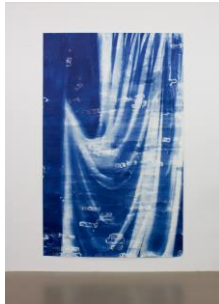
Ulla von Brandenburg Vorhang Blau 14, 2019 Cyanotypie auf Papier, 244 x 151 cm Courtesy Ulla von Brandenburg und Produzentengalerie Hamburg © Ulla von Brandenburg

Rechtlicher Hinweis für die Nutzung im Rahmen der Pressearbeit: Die Bildunterschrift muss bei der Veröffentlichung angegeben werden. Das Bildmaterial darf nicht beschnitten, mit Schriftüberdruck oder in anderer Weise verfremdet abgebildet und nicht an Dritte weitergegeben werden. Die Veröffentlichung ist nur gestattet im Rahmen aktueller Berichterstattung über die Ausstellung (Nutzungszeitraum: 3 Monate vor Ausstellungsbeginn bis 6 Wochen nach Ausstellungsende). Digitale Bilddateien dürfen nicht archiviert werden. Einstellungen auf Websites bitte nur in 72 dpi.