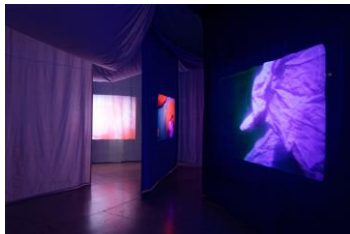
Ulla von Brandenburg Personne ne peint le milieu, 2019 Gefärbte Stoffe und fünf Super-16mm-Filme, übertragen auf HD-Video, Farbe, stumm Ausstellungsansicht Palais de Tokyo, Paris, 2020 Foto: Aurélien Mole Courtesy Ulla von Brandenburg und Art : Concept (Paris), Meyer Riegger (Berlin/Karlsruhe), Pilar Corrias Gallery (London), Produzentengalerie Hamburg © Ulla von Brandenburg