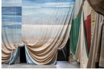
Ulla von Brandenburg Blaue und Gelbe Schatten V , 2021 Bemalte Stoffe, Seil, Ensemble aus Pappmaché-Objekten Ausstellungsansicht Le Voyage à Nantes , 2021 Foto: Martin Argyroglo Courtesy Ulla von Brandenburg und Art : Concept (Paris), Meyer Riegger (Berlin/Karlsruhe), Pilar Corrias Gallery (London), Produzentengalerie Hamburg © Ulla von Brandenburg