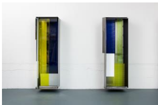
Camill Leberer Pandora 3-4 , 2017 Eisen, Glas, Farbe, je 220 x 65 x 50 cm