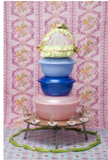
Ülkü Süngün aus der Serie »Transitional Objects« , 2011–2012 Farbfotografie auf Aludibond