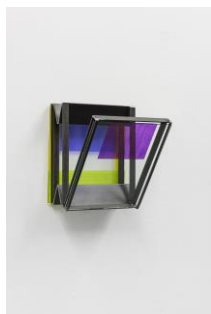
Camill Leberer, Das Ding , 2021 Eisen, Glas, Farbe, 37 x 34 x 33 cm Foto: Frank Kleinbach Courtesy Galerie Schlichtenmaier © VG Bild-Kunst, Bonn 2022