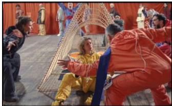
Ulla von Brandenburg Le milieu est bleu , 2020 Filmstill