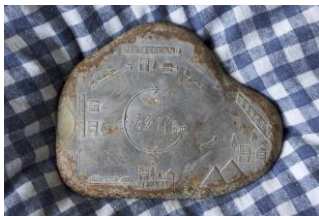
Ülkü Süngün aus der Serie »Lauter Steine« , 2014–2015, aus der Werkgruppe »Anlatsam Roman Olur / Die besten Romane schreibt das Leben« , 2014–2016 Farbfotografie auf Aludibond Ministerium für Wissenschaft, Forschung und Kunst Baden-Württemberg