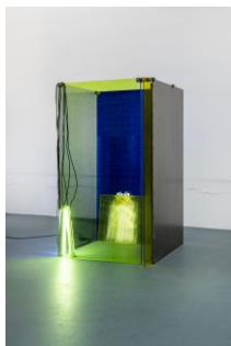
Camill Leberer Glashaut , 2019–2020 Eisen, Glas, Farbe, Neon, Kabel, 210 x 120 x 120 cm