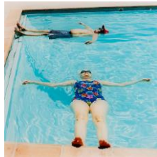
Peter Granser Paar im Pool (Sun City) , 2001 C-Print, 50 x 50 cm Kunstmuseum Stuttgart