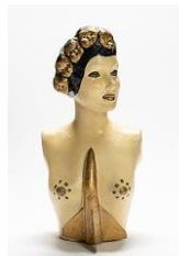
Anne Marie Jehle Ohne Titel , ohne Jahr Holz, Karton, Gips und Farbe, 64 x 30 x 30 cm Kunstmuseum Stuttgart, Schenkung Anne Marie Jehle Stiftung