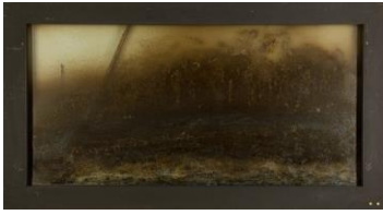
Dieter Roth Doppelkäseplatte , um 1968 Organische Materialien und Holzleiste zwischen zwei Glasscheiben, Messingrahmen, 120 x 230 x 9 cm Kunstmuseum Stuttgart