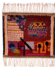
Ida Kerkovius Blühender Garten , 1960 Handgewebter Teppich aus Wolle, 129 x 150 cm Kunstmuseum Stuttgart © Kerkovius Archiv Wendelstein