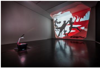
Kara Walker For the Benefit of all the Races of Mankind (Mos' Specially the Master One, Boss) An Exhibition of Artifacts, Remnants, and Effluvia EXCAVATED from the Black Heart of a Negress IV , 2002 Scherenschnitt, Wandprojektion, Maße variabel Installationsansicht: Kunstmuseum Stuttgart, 2025 Dauerleihgabe der Freunde des Kunstmuseums Stuttgart © Kara Walker, Courtesy Sprüth Magers and Sikkema Jenkins & Co.