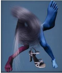
Tim Berresheim Rot Blau III , 2007 Foto auf Dibond, 143,5 x 123 x 4,5 cm Kunstmuseum Stuttgart Schenkung Stephanie und Patrick Majerus

Die Veröffentlichung von Pressebildern ist nur gestattet im Rahmen aktueller Berichterstattung über die Ausstellung, d.h. ab 3 Monate vor Ausstellungsbeginn bis 6 Wochen nach Ausstellungsende. Das Bildmaterial darf nicht beschnitten, mit Schriftüberdruck oder in anderer Weise verfremdet abgebildet und nicht an Dritte weitergegeben werden. Pressebilder dürfen nur unter Angabe des vollständigen Copyrightvermerks veröffentlicht werden. Digitale Bilddateien dürfen nicht archiviert werden. Jede andere Nutzung der Pressebilder kann das Urheberrecht verletzen und rechtlich verfolgt werden.