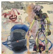
Markus Oehlen Ohne Titel , 2005 Mischtechnik auf Leinwand, 200,5 x 200 x 4,5 cm Kunstmuseum Stuttgart, Schenkung Alison und Peter W. Klein, Eberdingen-Nussdorf © Markus Oehlen