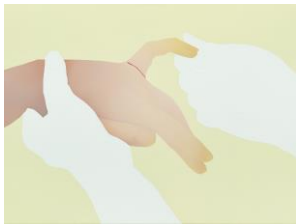
Vivian Greven Ico II , 2019 Öl und Acryl auf Leinwand, 110 x 150 cm Kunstmuseum Stuttgart © Vivian Greven