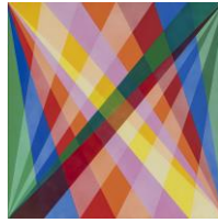
Anton Stankowski SEL-Zeichen , 1958 Öl auf Leinwand, 90 x 90 cm Kunstmuseum Stuttgart, Schenkung der Stankowski-Stiftung